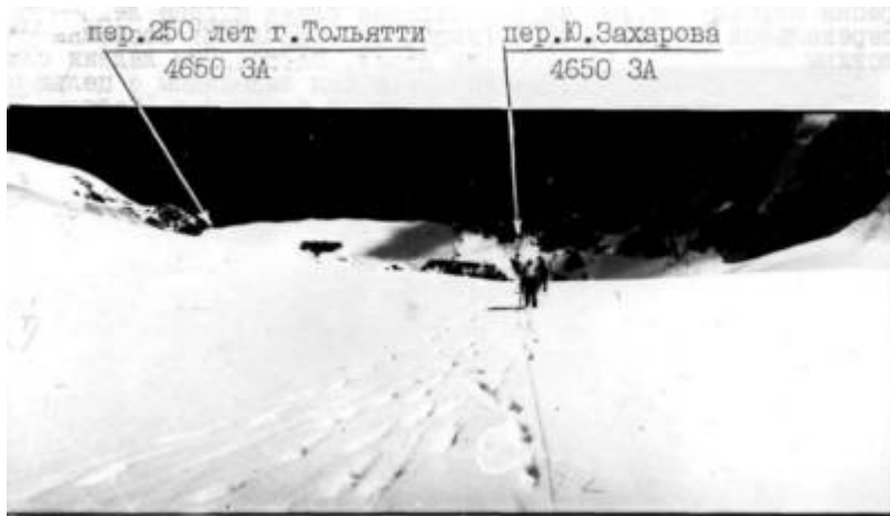
Фото 17. Верхний южный цирк.