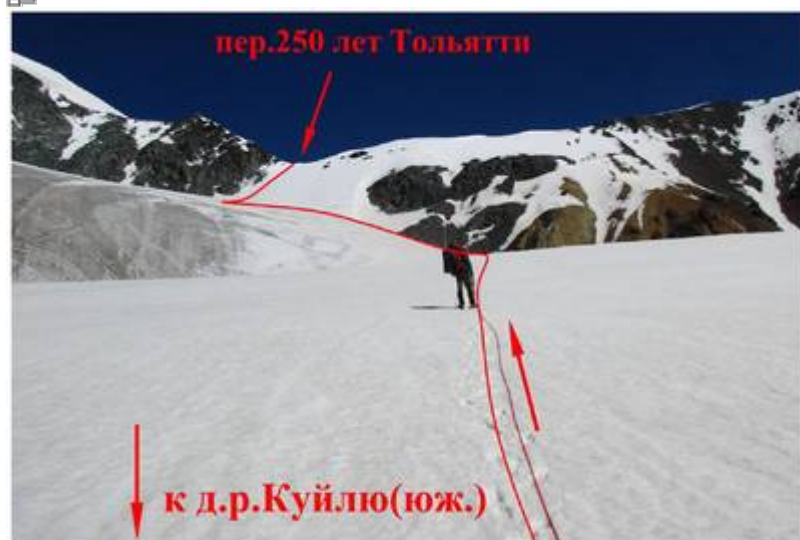
Пер. 250 лет Тольятти с юга.