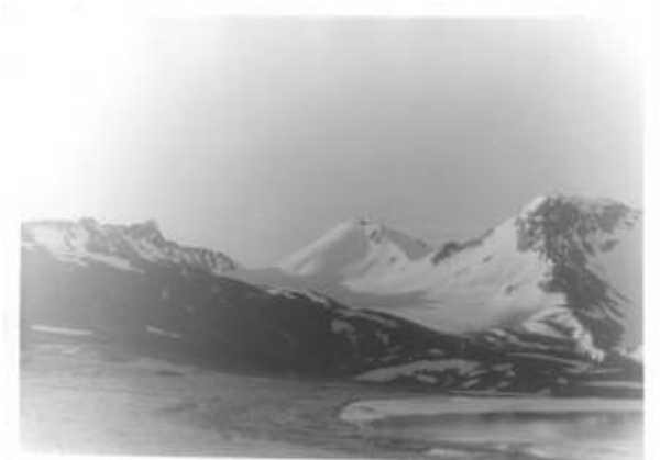
Пер. 60 лет Казахстану. Фото Обольского О., 1993 г.