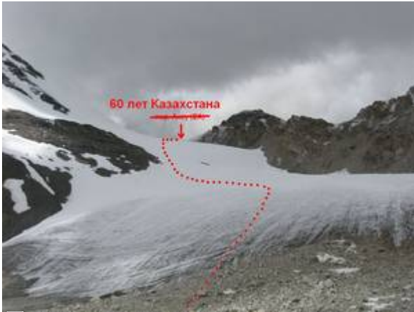
Фото Большаковой Т., 2010 г.