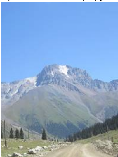
Вид из ущелья Барскаун. Фото Цветкова А.В., 2017 г.