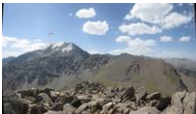
Вид с в. Котур. Фото Цветкова А.В., 2015 г.