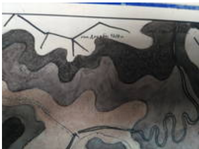
Фрагмент схемы маршрута №2 из методкабинета турбазы Иссyk-Куль

Вершина обозначена на схеме маршрута №2 из методкабинета турбазы Иссyk-Куль. С юга с перевала №7 возможно простое восхождение на вершину категории 1Атур.