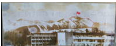
Фото из музея военного санатория в Тамге