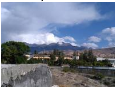
2017 г.