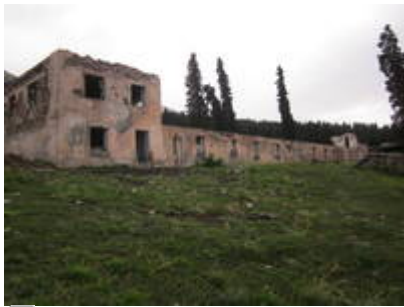
Развалины горной базы

На топокарте эта вершина называется Котур, а на турбазе её называли Шлем Будённого. На вершину можно совершить несложное восхождение категории 1Атур с севера от развалин горной базы или с юго-запада с перевала Сары-Кунгей.